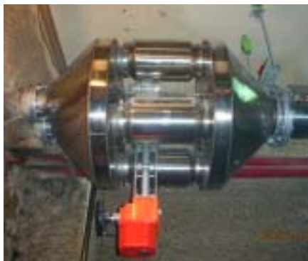
ARIC 過濾式陶瓷觸媒淨化

AIRC 陶瓷觸媒黑煙淨化器有兩項特點來解決此問題：C 2 和 PX 系列三元催化篩檢程式的工作原理和傳統的黑煙篩檢程式類似，但沒有長時間使用後阻塞的壽命限制。當柴油發動機廢氣通過半通性蜂窩陶瓷時，顆粒狀物質被有效地過濾在陶瓷壁上，粒狀污染物過濾效果可達到總顆粒數 90%以上，同時陶瓷表面上的催化劑降低了這些過濾物質的燃點，只要排氣溫度達到一定的值便可以產生持續性的自燃，進而消除柴油引擎排氣中的黑煙。搭配經由專利製造的旁通閥門，使用電磁閥方式啟閉閥門，並配附加熱裝置使陶瓷觸媒淨化器能完全自動再生以達到其工作效能。